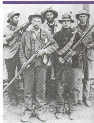
Guerrilleros de la Segunda Guerra de los Bóers, durante la cual se enfrentaron al Imperio británico.

El objetivo del gobierno británico era consolidar sus dominios desde Ciudad del Cabo hasta El Cairo, unida por una línea de ferrocarril. En 1884, cuando se descubrió oro en Transvaal, el Imperio británico fomentó la entrada de avetureros y empresarios de otros países, conocidos como uitlanders (extranjeros), que provocaron desórdenes en las repúblicas bóers. El conflicto llegó a su clímax durante la llamada incursión de Jameson. Los británicos de Sudáfrica eran dirigidos por Cecil Rhodes, primer ministro de la Colonia del Cabo y defensor de la política expansionista del imperio, quien alentó al doctor Leander Jameson para que organizara una invasión a Transvaal, planeándola de tal forma que coincidiera con un levantamiento de los uitlanders en Johannesburgo. Sin embargo, el levantamiento no ocurrió y al presidente de Transvaal, Paul Kruger, no le fue difícil derrotar a los invasores. La resistencia bóer a los uitlanders se endureció debido a las leyes que se aprobaron para restringir la inmigración, además de las limitaciones que se impusieron a las garantías de libertad de reunión y de prensa. Las repúblicas bóers renovaron una alianza defensiva y lanzaron un ultimátum al gobierno inglés, que lo rechazó, y fue así como estalló la Guerra de los Bóers el 11 de octubre de 1899.