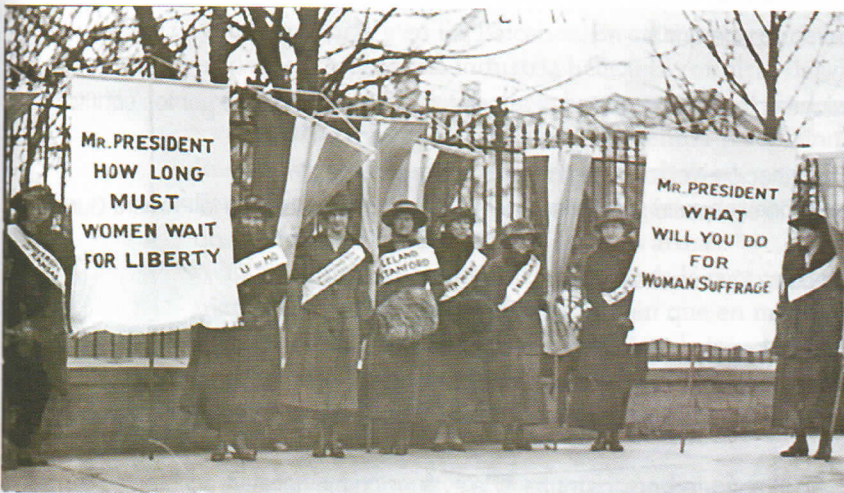
Fotos y pinturas de sufragistas británicas y estadounidenses en el siglo XIX.