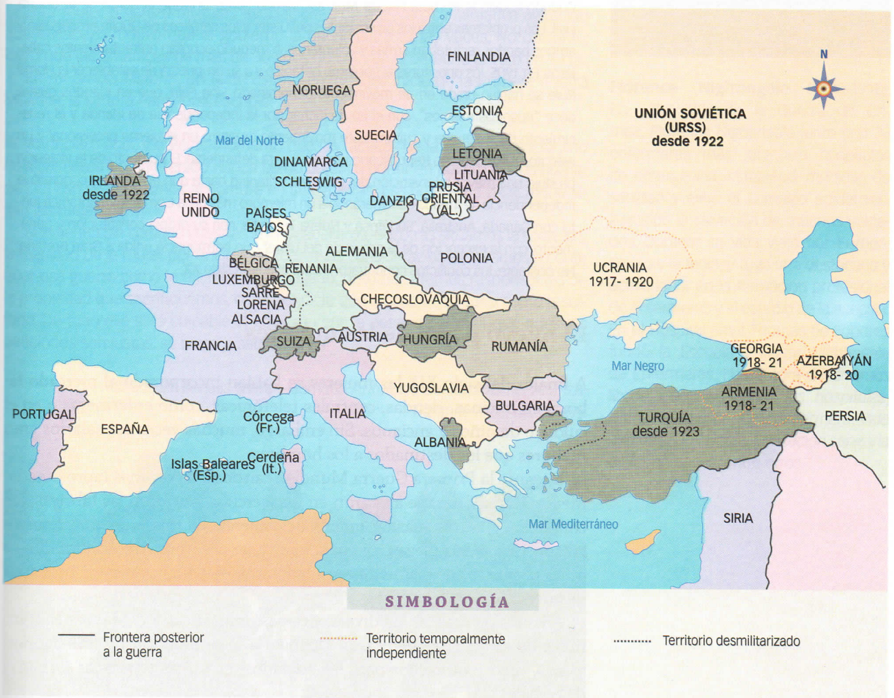
Europa y el medio Oriente después de la Primera Guerra Mundial.

Tomando como base la idea de la autodeterminación nacional impulsada por Wilson, surgieron nuevos Estados nacionales étnico-lingüísticos. Estos Estados adoptaron constituciones parlamentarias y reglas capitalistas en sus relaciones económicas. Como coexistían diversas nacionalidades, se prometió proteger los derechos de las minorías y, en especial, de los judíos; pero en el futuro esto no se respetó.