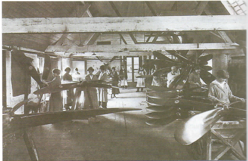
Mujeres británicas trabajan en una fábrica de armas.

Como resultado de la Gran Guerra y de la Revolución rusa, la idea de que las mujeres eran seres débiles, inferiores, irracionales, que carecían de talento y sentido común fue combatida y la población femenina empezó a crear organizaciones de obreras y a participar en la política. Las mujeres conquistaron el derecho al voto y la igualdad de derechos civiles frente al hombre en casi todo el mundo.