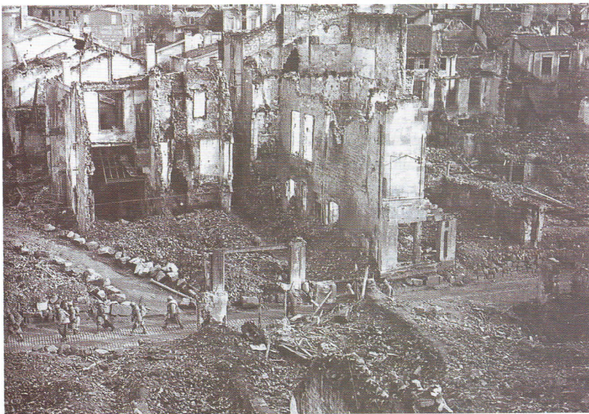
Una vez concluida la guerra se celebró el triunfo de la libertad política y la supremacía de los civiles y ya no de los militares en los gobiernos. Además se emprendieron los trabajos de reconstrucción de carreteras, puentes y puertos y recuperación de la producción de alimentos.

había reducido, incluso éstos escaseaban. También el racionamiento de los combustibles (carbón, madera y petróleo), debido a las necesidades del ejército, había disminuido la posibilidad de la calefacción en invierno.