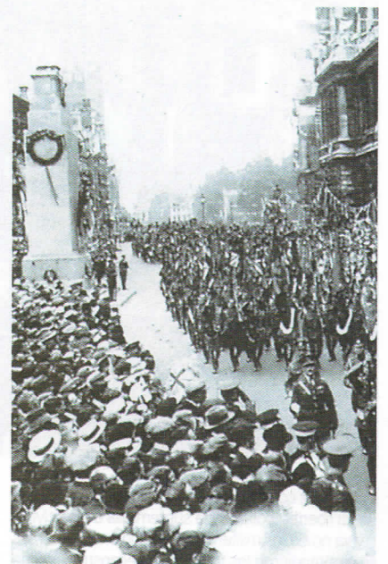
Celebración por el fin de la guerra.

El 28 de junio de 1919 se firmó el Tratado de Versalles. En él se impusieron duras condiciones a Alemania por considerarla responsable de la guerra junto con sus aliados.