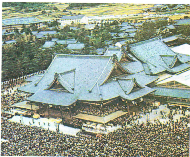
Reunión de sintoístas.

La mayor parte de los japoneses mantenían la ancestral devoción por la disciplina militar, el sacrificio personal en beneficio de la nación, la jerarquía social y el cumplimiento de las órdenes dadas por los superiores. Muchos conservaban la creencia en su superioridad y la necesidad de proteger la pureza de su raza.