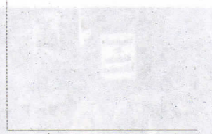
El crack del 29 y la depresión de los años 30.

La crisis económica de 1929 marcó el fin del largo periodo de actividad acelerada que había caracterizado al capitalismo a lo largo del siglo XIX, y dio inicio a uno de recesión. Es decir, un periodo (mayor a seis meses) durante el cual el porcentaje de crecimiento del Producto Interno Bruto (PIB) de una economía es negativo. El PIB es el valor monetario de los bienes y servicios finales producidos por una economía en un periodo determinado.