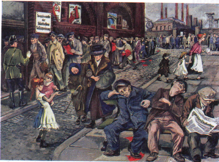
Gran Depresión de 1929, impresión a color.

Una característica de este sistema fue la posición ocupada por Estados Unidos como el país capitalista más poderoso, del cual dependerán una gran parte de las economías de los países no industrializados. Otra fue la introducción de innovaciones tecnológicas que favorecieron el incremento y la diversificación de la producción, así como una mayor extensión e influencia del sistema capitalista a nivel mundial. Una tercera fue la desaparición de los últimos restos de las economías regionales o no capitalistas, para dar paso a una total dependencia del sistema capitalista, con lo cual la brecha entre desarrollo y subdesarrollo fue más profunda.