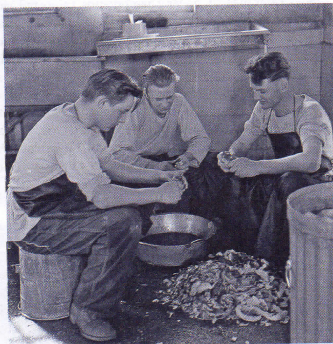
Tres jóvenes pelan patatas como parte de la campaña de trabajo de la Civilian Conservation Corps o CCC, creada por el presidente Roosevelt para dar trabajo a los jóvenes desempleados entre 1933 a 1942.

Concluía así una crisis institucional que dividió a la opinión pública inglesa, y que tuvo su origen cuando Eduardo VIII anunció su intención de casarse con Wallis Simpson, una divorciada y bella mujer norteamericana, y tanto la casa real como el partido conservador en el poder se opusieron al matrimonio.