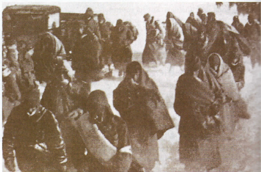
Se calcula que en la batalla de Stalingrado murieron alrededor de un millón de personas: medio millón de soldados del Eje y medio millón del Ejército Rojo.

El ejército soviético inició su avance hacia el oeste. Entre 1943 y 1944, el ejército alemán se vio obligado a abandonar todas sus posiciones en Rusia, Crimea, Ucrania, Bielorrusia y Polonia.