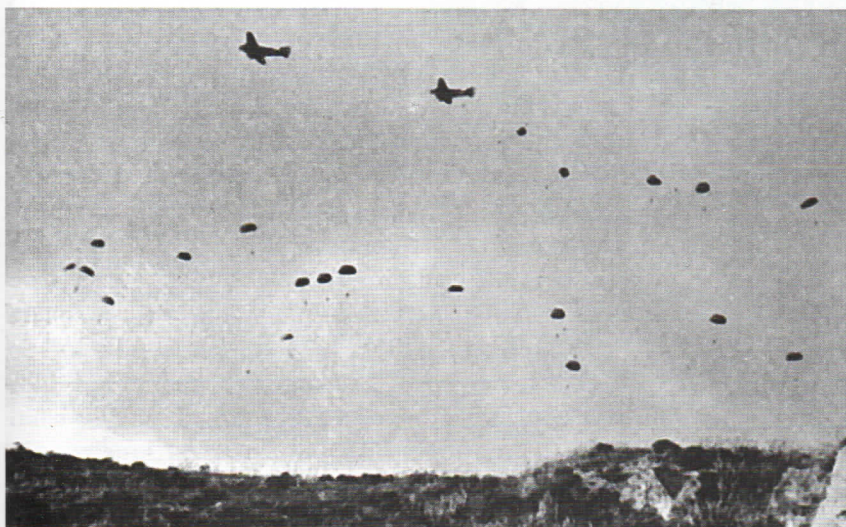
Paracaidistas alemanes toman la isla griega de Creta.

En 1941 las colonias del norte de África y los mandatos concedidos a Francia y Gran Bretaña por la Sociedad de Naciones estaban amenazados por el ejército alemán. En esas fechas, Hitler planeaba un ataque sorpresa contra la Unión Soviética.