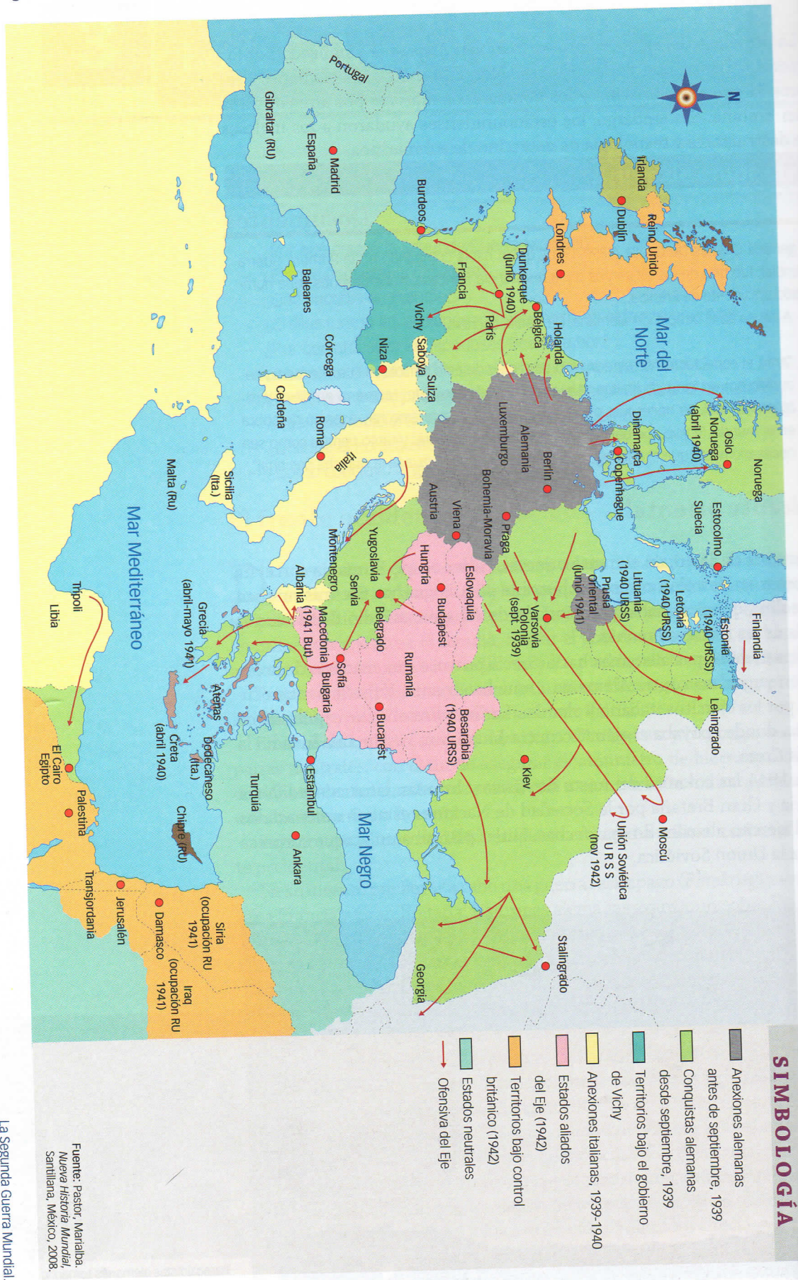
La Segunda Guerra Mundial.

Fuente: Pastor, Mariela. Nueva Historia Mundial , Santillana, México, 2008.