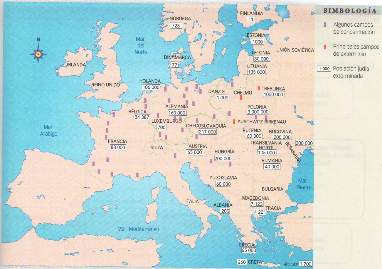
El exterminio judío durante la Segunda Guerra Mundial.